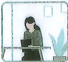
入居申込と一緒に申込み

パレット電気&パレットガスは入居申込時にまとめてお申込みいただくため、お手続きが非常に楽になります。申込費用や解約金等も発生いたしませんので、ご安心ください。