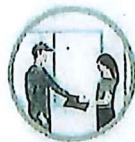
ガスのみ開栓の立会い が必要です